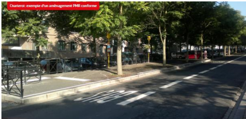
Charleroi: exemple d'un aménagement PMR conforme