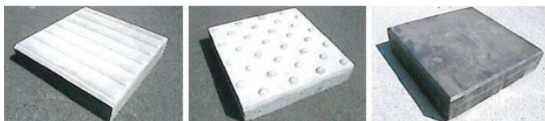
(a) la dalle de guidage (b) la dalle d'éveil à la vigilance (c) la dalle d'information

Au droit des traversées piétonnes, afin d'assurer le guidage et la sécurité des personnes qui ont une déficience visuelle, les trottoirs seront munis de dalles de repérage. Plusieurs types de dalles existent et ont des buts bien précis (orientation, éveil à la vigilance, etc.).